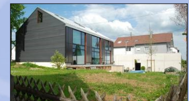
‚Alte Turnhalle Gerstetten‘. (Innenansicht: s. Titelbild)